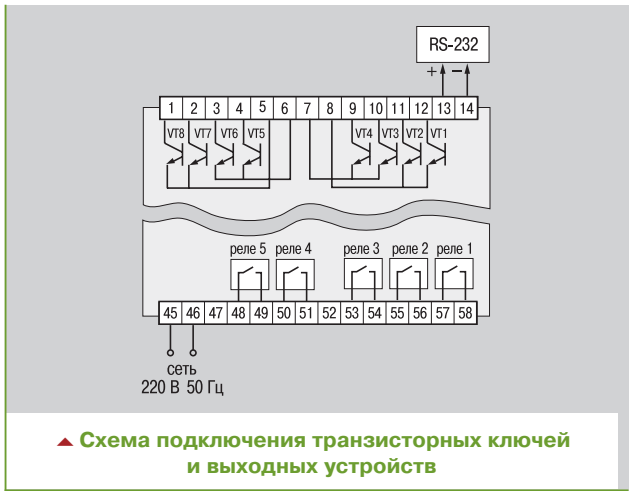
▲ Схема подключения транзисторных ключей и выходных устройств