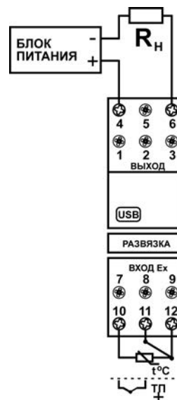
Рисунок 3.1 – Схема подключения преобразователя